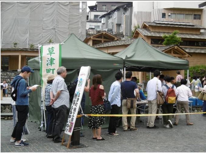
(誘客ふるまいイベント事業)

平成30年1月23日草津本白根山の水蒸気噴火による風評被害対策により、2月10日～5月31日までの毎週土曜日に湯畑「湯路広場」にて味噌おでんや甘酒・花豆しるこや熊笹茶のふるまいを実施しました。尚6月は3日に誘客対策イベントとして商工会役職員及び青年部員による「商工祭」を開催し、商工会員と青年部による18店の事業所が出店し賑いのある湯路広場となりました。