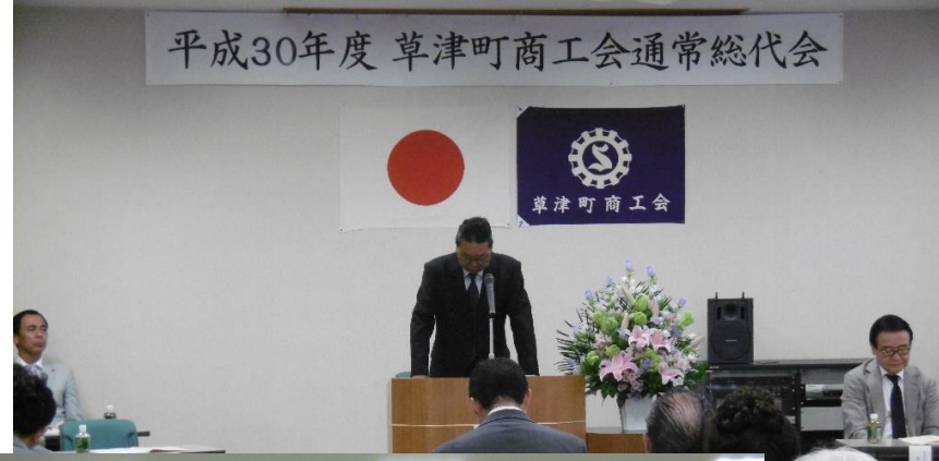
挨拶をする武藤会長

去る五月十八日(金)午後二時より草津町商工会館に於いて、草津町長をはじめ多数の御来賓の御臨席を賜り厳粛のうちにも盛大に開催され、平成二十九年度の事業報告承認の件を始め、上程した十二議案すべてが原案のとおり可決承認されました。昨年度の事業として、経営発達支援計画が承認されたことにより、商工会の役割である事業者の経営の手助けをする「伴走型支援」の体制が整備されました。 また、平成二十八年度補正一次「小規模事業者持続化補助金」の申請を行い、七件が採択されました。また、湯畑「湯路広場」において、草津・湯の街商工祭 湯畑マルシェ「エニエニ」が昨年引き続き開催され、たくさんのお客様に会場いただきました。