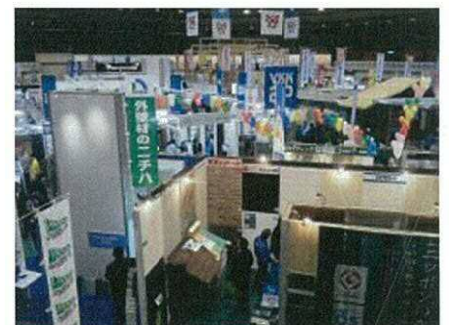
販路開拓のための展示会出展