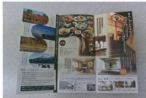
PRの強化を目的としたチラシやパンフレットの作成