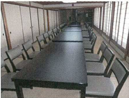
新規顧客獲得のための新設備・什器導入