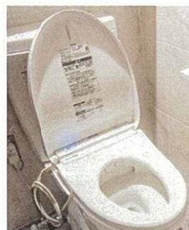
トイレの洋式化改修