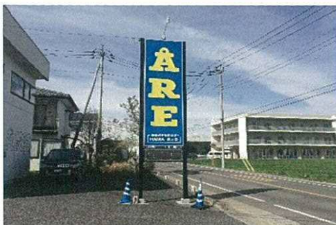
店舗の認知度向上を狙った看板（サイン）の設置